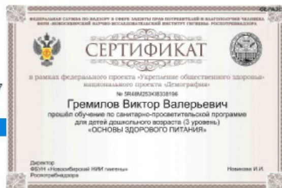
Рис. 15. – Просмотр результатов итогового тестирования и получение сертификата, подтверждающего успешность прохождения обучения

В случае если набрано менее 80% правильных ответов, Программа указывает проблемные разделы и предлагает пройти тестирование повторно. Количество повторных тестирований не ограничено по количеству, но ограничено по времени. Повторное тестирование можно пройти не ранее чем через 24 часа от предыдущего тестирования.